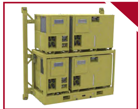
▾ Variante 2: 2 x Kälte, 2 x Wärme kaskadiert