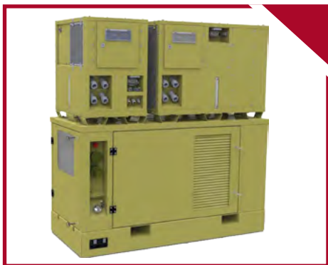
▾ Variante 1: SEA, Kälte, Wärme